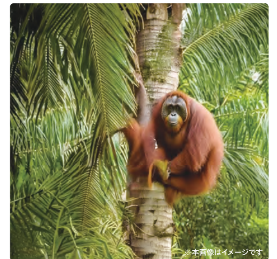
※本画像はイメージです