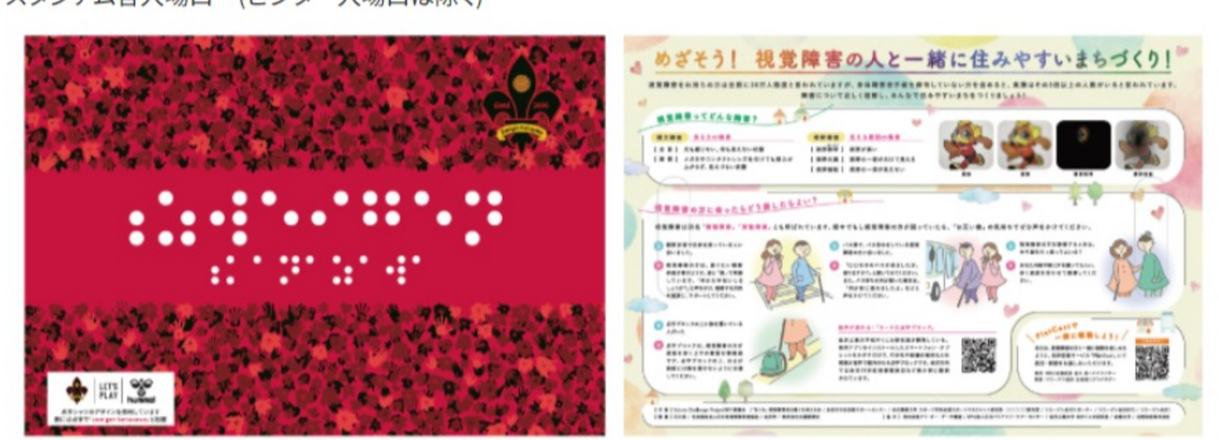
表面 (点字シャツデザイン)