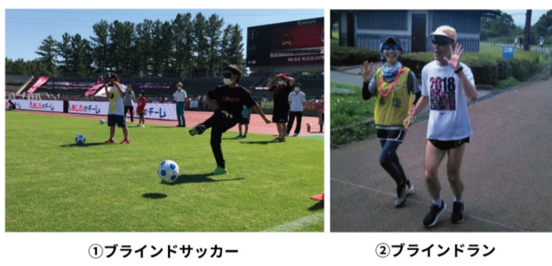
①ブラインドサッカー

・ご注意事項 雨天の場合は、内容の変更、中止になる可能性もございますのでご了承ください。