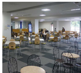
A 館 3F 学生ホール