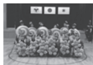
写真2 又次節での交流