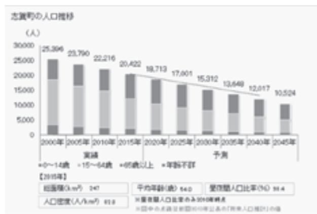
図1 石川県志賀町の人口推移

現在、能登における過疎化、高齢化による地域の衰退が著しい上、深刻な後継者不足が問題となっている。地域の伝統技術や文化・祭礼等を確実に次世代へ引き継いでいくために、地域を引っ張っていく担い手の確保が必要である。志賀町の人口推移を見ると、年々人口が減少していることが分かる（図1）。また志賀町では近年、高齢化と共に若い世代の転出者が増加している。この問題点を解決するために考えられる方法の一つとして、Uターン者を確保ことが考えられる。2018年度「いしかわ里山塾」ではふるさと教育として、外部者、若者目線からみた「志賀町の魅力」を存分に伝え、地元の児童に地元の魅力を再発見してもらうことが目的である。