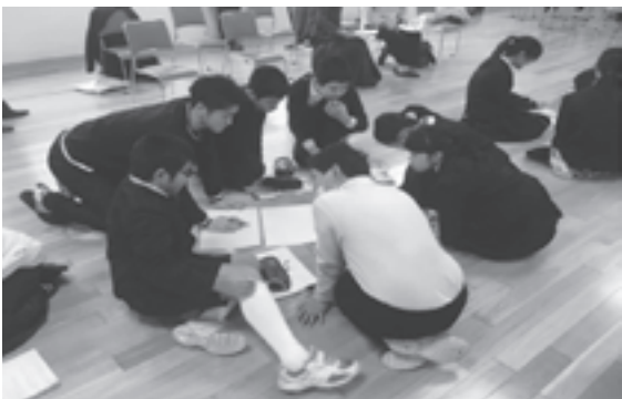
写真3 グループワークの様子

又次節を次世代へ継承させるため、また、今後の発展には何をすべきなのかストーリーはあえて途中で終わらせ、その続きをグループワークで考えてもらった（写真3）。児童達の発想力を育む事が狙いである。