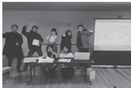
写真4 メンバーの集合写真

展望として、今回各地域で授業を受けた児童達が、地域をより好きになり、将来志賀町をもし離れたとしても、なにかの機会にUターンすることを願うと同時に、地域の伝統技術や文化・祭礼等を確実に次世代へ引き継いでいって欲しい。